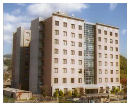
岡山大学 アクセスマップ