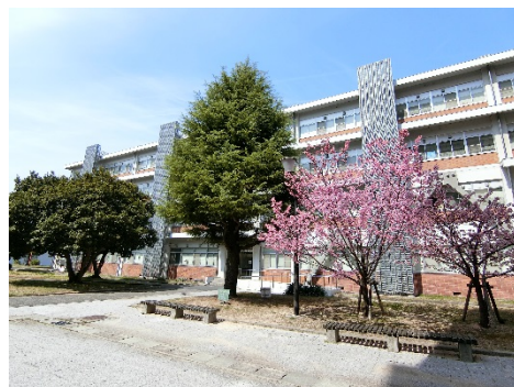
岡山大学 アクセスマップ