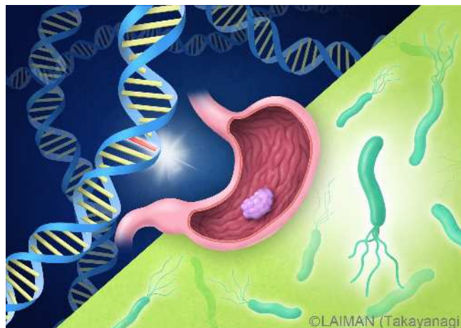
遺伝要因とピロリ菌感染による胃がんリスク

本研究は、総合医学雑誌『 The New England Journal of Medicine 』オンライン版（3 月 29 日付：日本時間 3 月 30 日）に掲載されます。