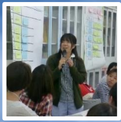
妊娠中からの虐待予防