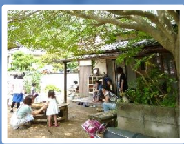
子育て広場で学ぶ