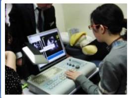
超音波シミュレーター