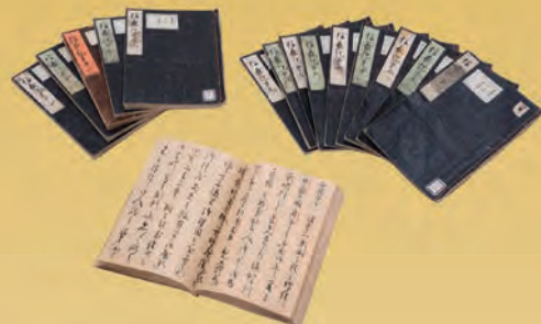
信長記（重要文化財）から一部