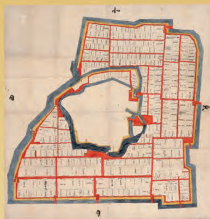
〔姫路城内家臣用屋敷割図〕