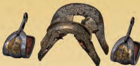
青貝泊蝶紋付鞍・獅子金象嵌鎧 池田輝政・利隆所用