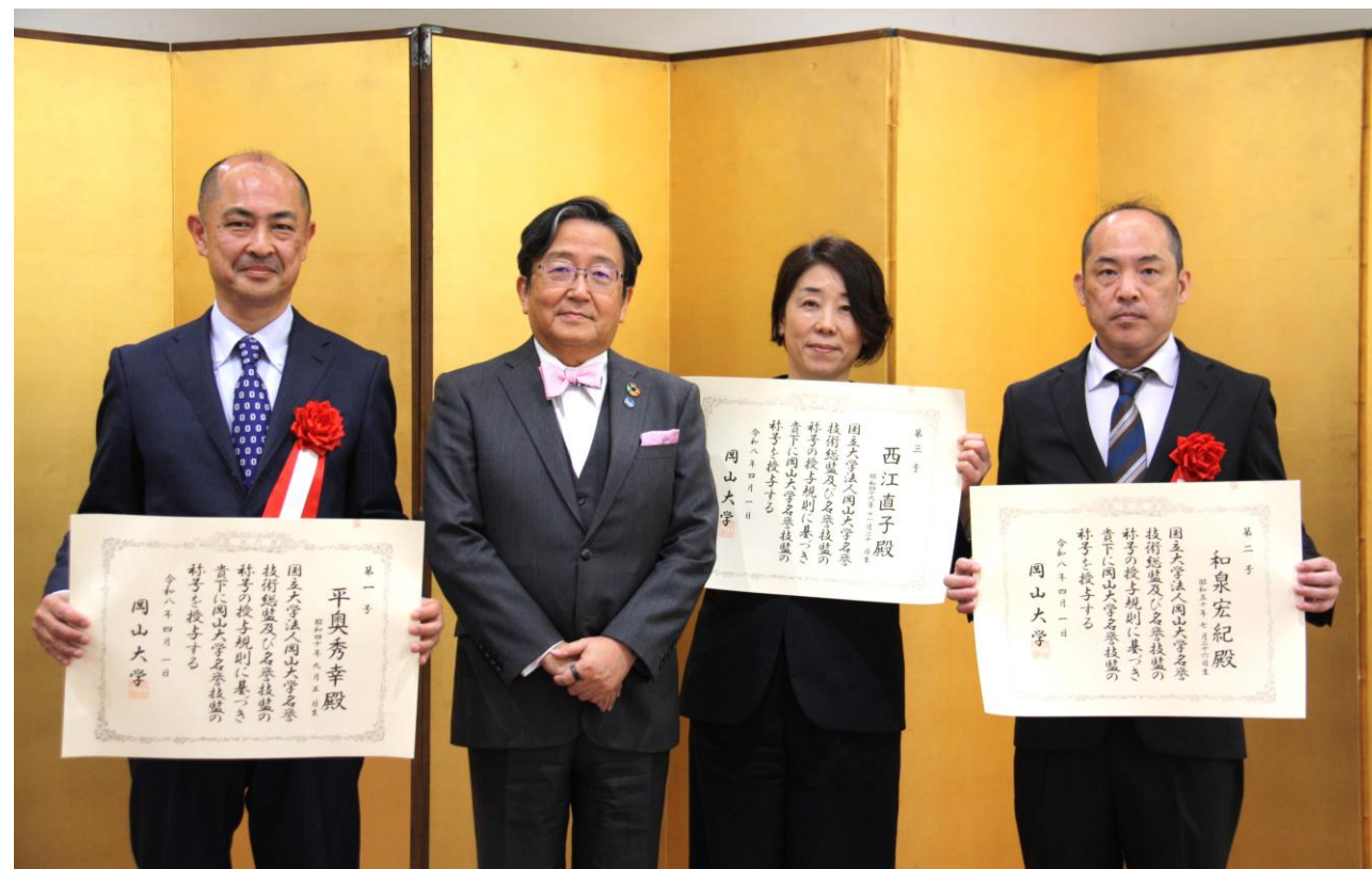
(左から)平奥名誉技監、那須学長、西江名誉技監、和泉名誉技監