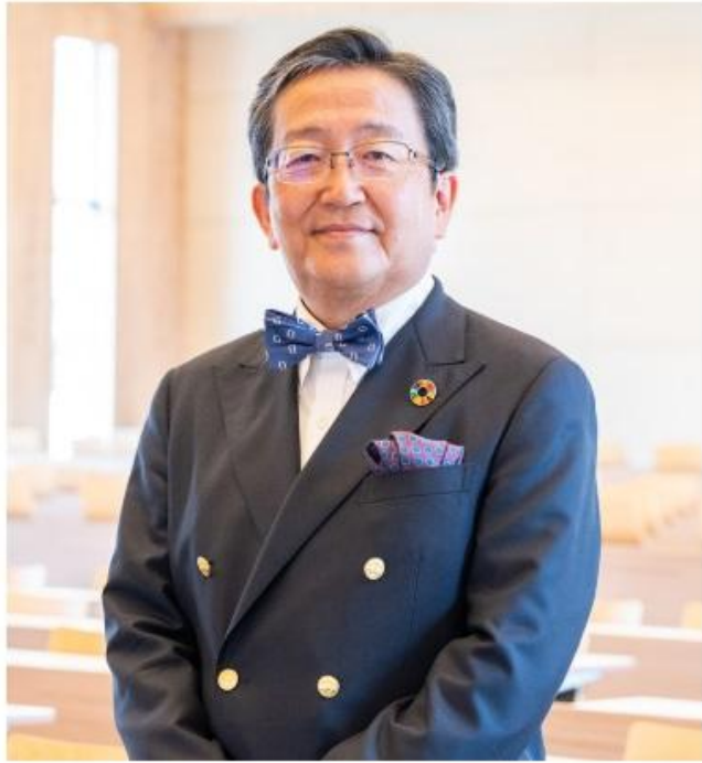
国立大学法人岡山大学 第15代学長(第5代法人の長) 那須 保友