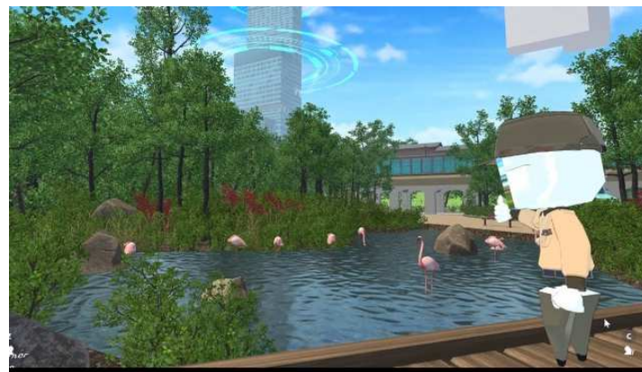
現役飼育員による「バーチャル天王寺動物園ツアー」のイメージ