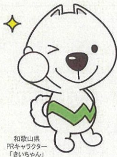
和歌山県 PRキャラクター 「きいちゃん」