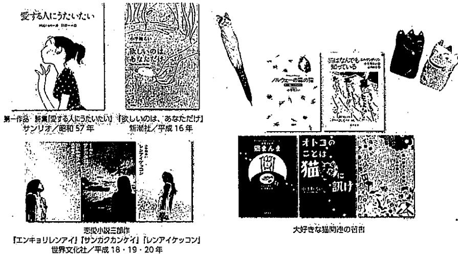
第一作『愛する人にうたいたい』『欲しいのは、あなただけ』サンリオ/昭和57年 新潮社/平成16年