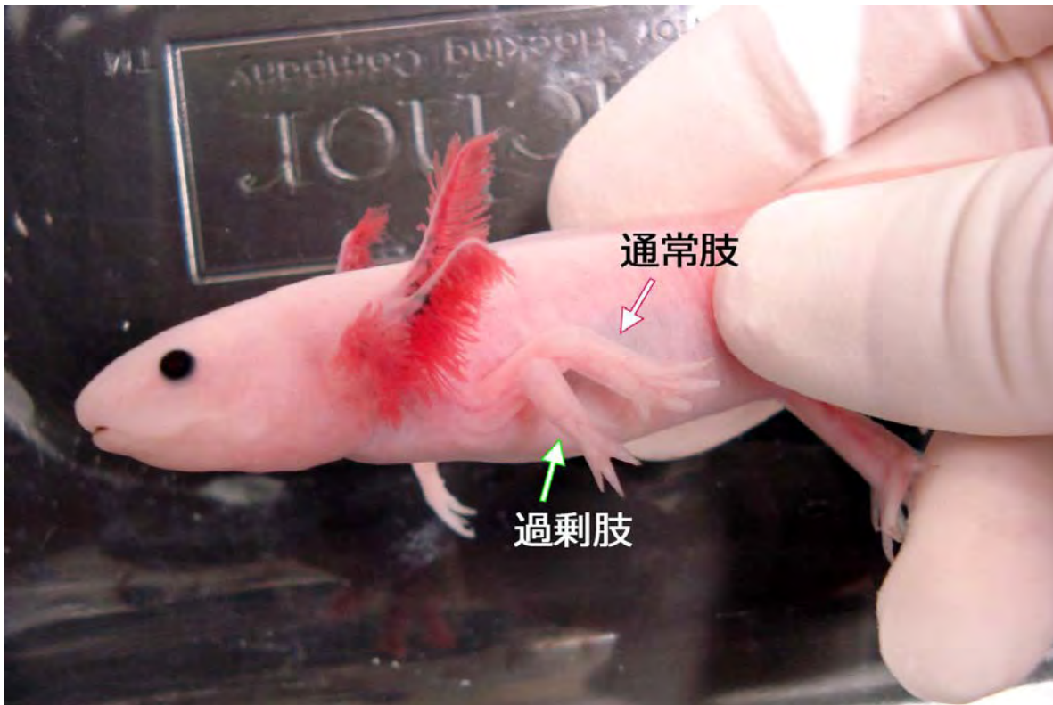
図1 過剰肢付加モデルにおける代表的表現型

皮膚損傷だけでは皮膚の修復が起こるだけであるが、皮膚損傷後に神経を外科的に遊走させることで、図のような過剰肢を誘導する過程につなげることができる。