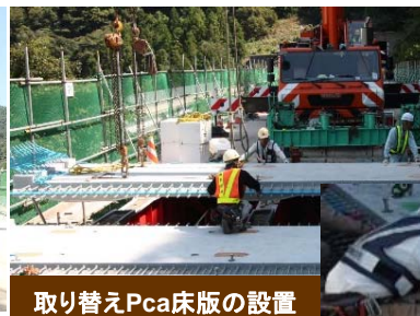
取り替えPca床版の設置