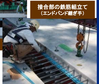
接合部の鉄筋組立て (エンドバンド継ぎ手)