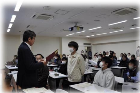
受講者36名全員に修了証書授与