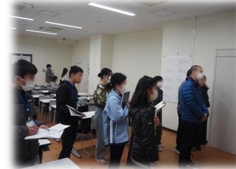
保護者の方も前列で聞かれています