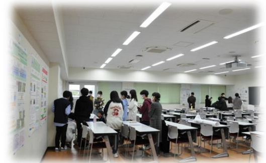
2教室にわたって36名全員のポスターを掲示