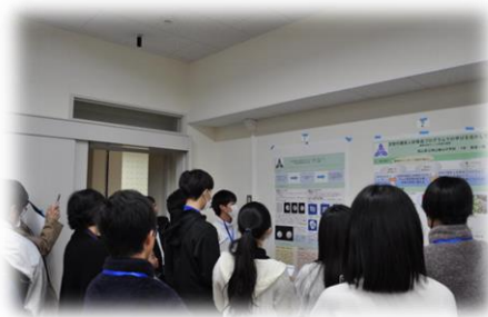
6班に分かれて発表をする