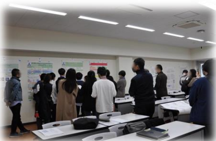
受講生も保護者の方も質問されています