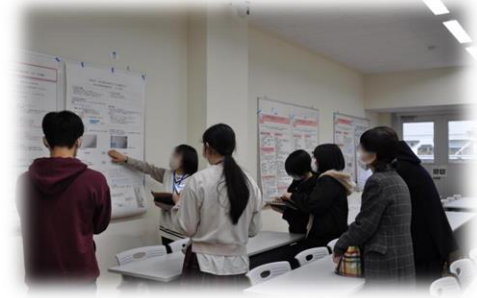
保護者の方も熱心に聞かれています