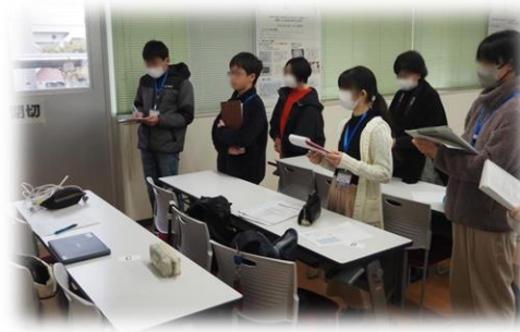
熱心にメモを取っています