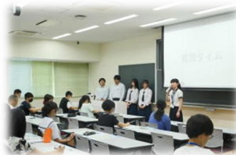
受講者からの質問を受けて