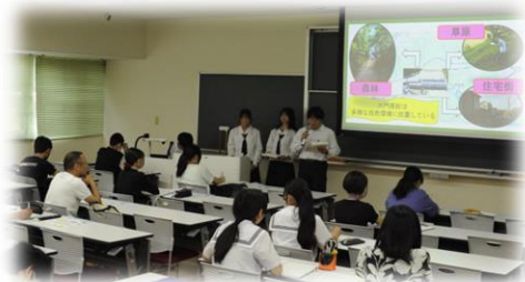
第1回講座 大門高等学校生物部によるチョウの研究のプレゼン