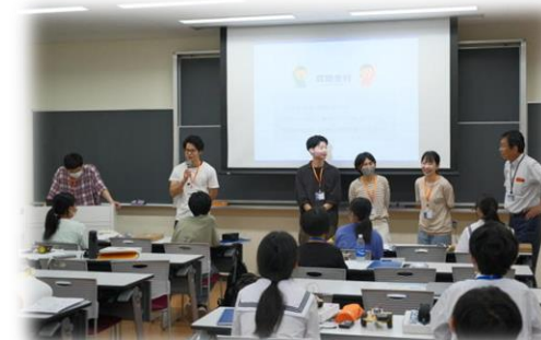
技術補佐員の院生の皆さんを紹介