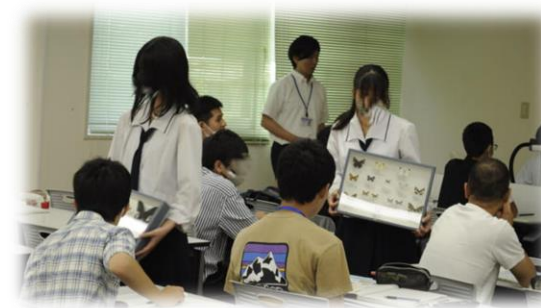
チョウの標本を提示