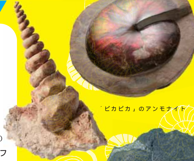
「ピカピカ」のアンモナイト

日時 7月20日(土)・21日(日) 展示室に化石観察コーナーが登場(終日)! お気軽にお立ち寄り下さい。 11時・14時にはスタッフによるギャラリートークもあります。(各回30分程度) 会場 化石展示室・多目的展示室 案内役 林原自然科学博物館スタッフ