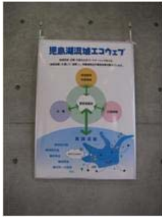
児島湖エコウェブポスター①