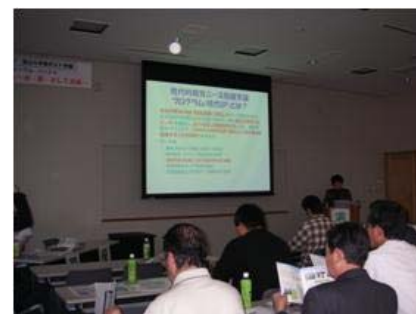
現代GPについて紹介する 沖学部長