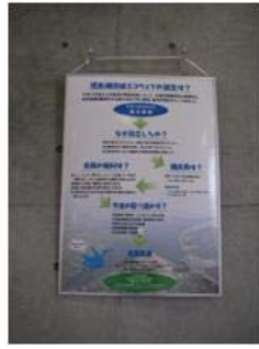
児島湖エコウェブポスター②