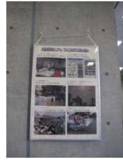
児島湖エコウェブポスター③