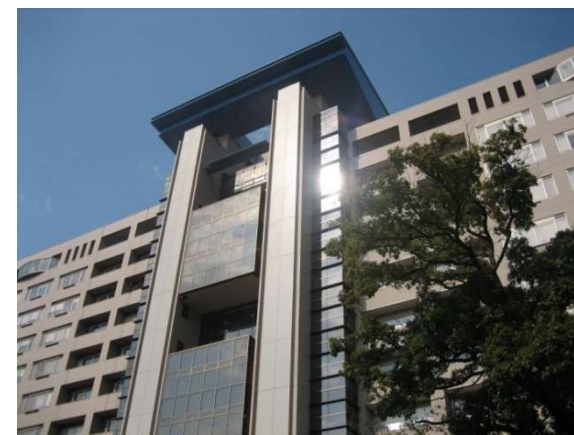
（岡山大学病院入院棟）