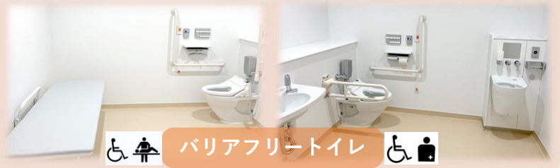
バリアフリースイレ