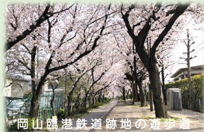
岡山臨港鉄道跡地の遊歩道