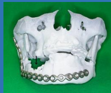
実物大3Dモデルを使ったモデルサージェリー

また、他部位への転移や鼻やのどへの周囲組織への浸潤がある大きな癌の場合、頭頸部癌センターと連携した治療を行っています。連携治療では手術に伴う咬みあわせのずれの予防、手術で切除した骨の再建の検討に模型を使用するなど歯科ならではの得意分野を生かした治療を行っています。