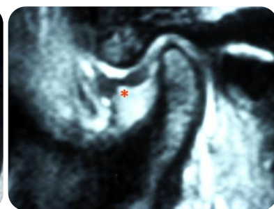
関節円板前方転位