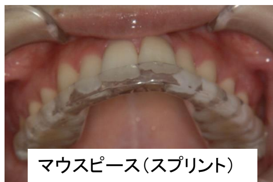
マウスピース(スプリント)