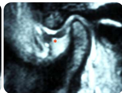
関節円板前方転位