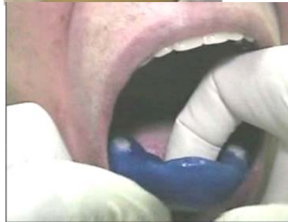
<機能運動を行いながら型取りしているところ>