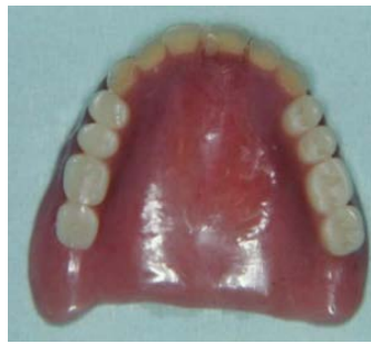
<通常の上顎の義歯>