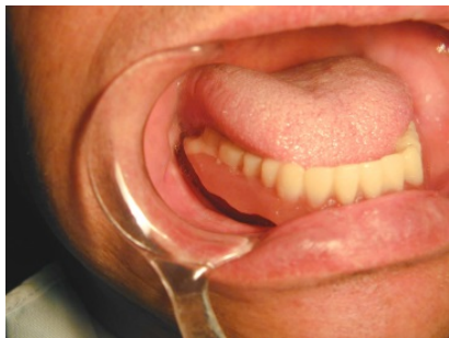
<浮き上がる下顎の義歯>