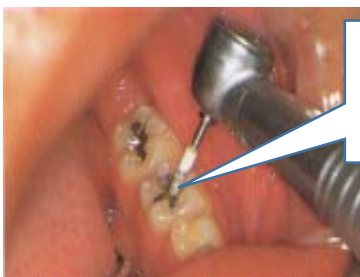
お口の中の金属を研磨