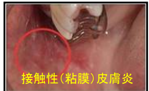
接触性(粘膜)皮膚炎