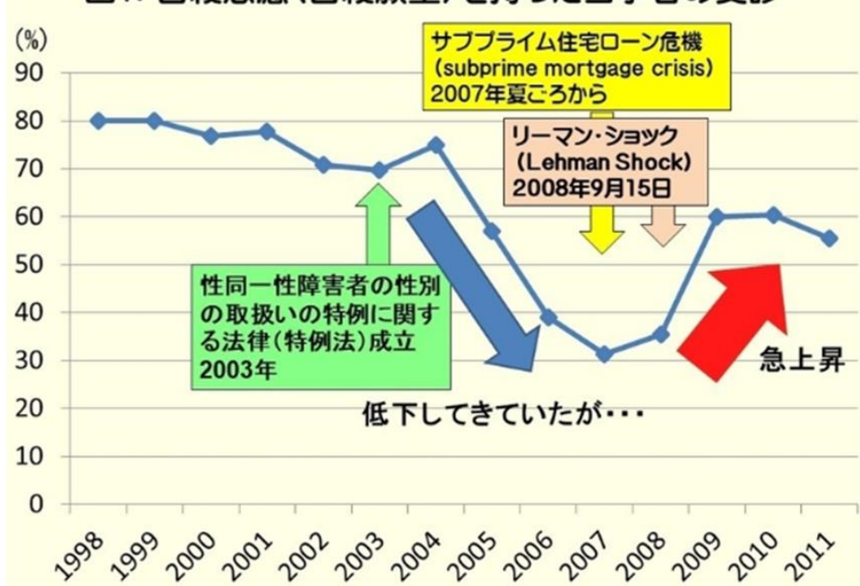
図1. 自殺念慮(自殺願望)を持った当事者の受診