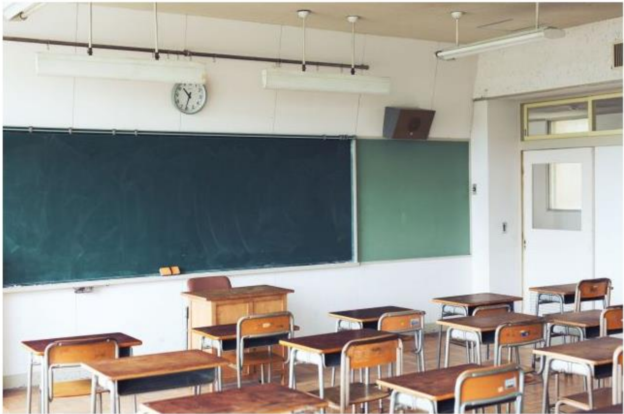
小学校に通う前にいくつかの壁があった（写真はイメージ）