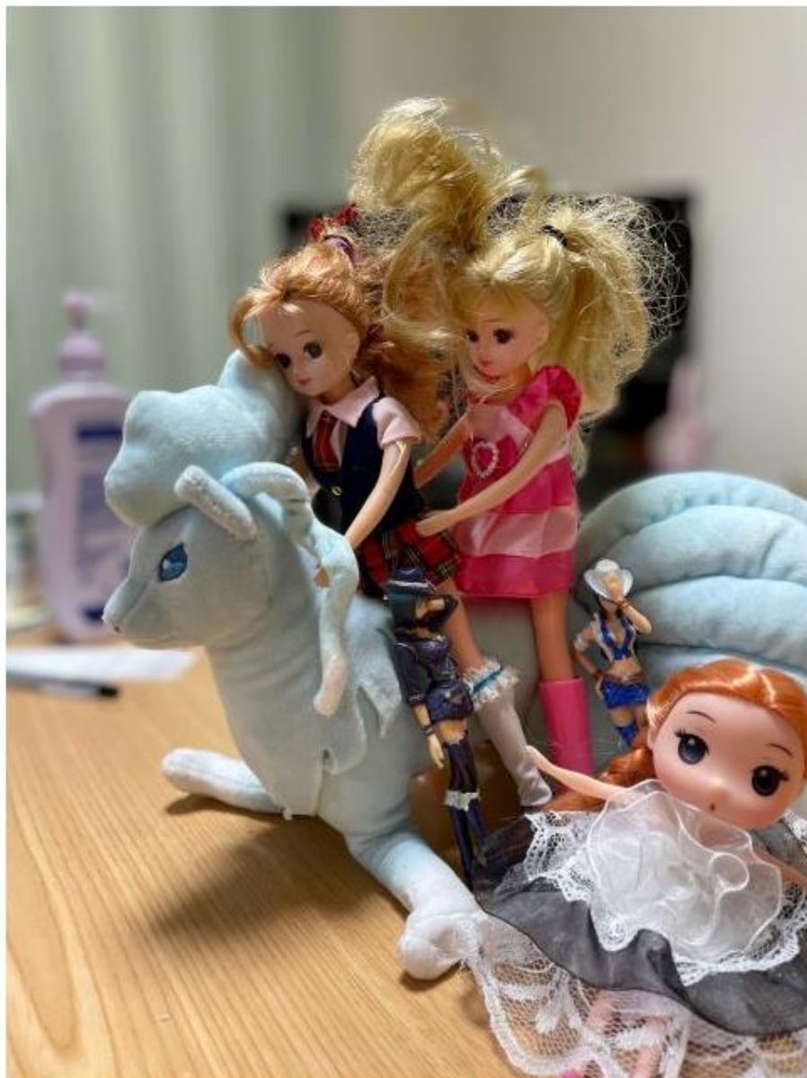
いっちゃんが保育園の時から持っている人形やぬいぐるみ

お父さん自身も、参観日に開かれた保護者会で「本人の意思を尊重したいので、知っておいてほしい」と他の保護者に説明したそうです。いっちゃんの本名が男の子しか使わない響きを含んでいたため、改名もしました。