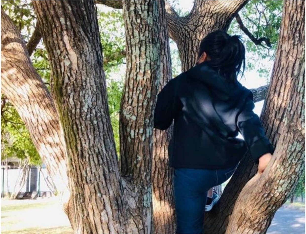
木登りするいっちゃん。髪は長く伸びました=2020年