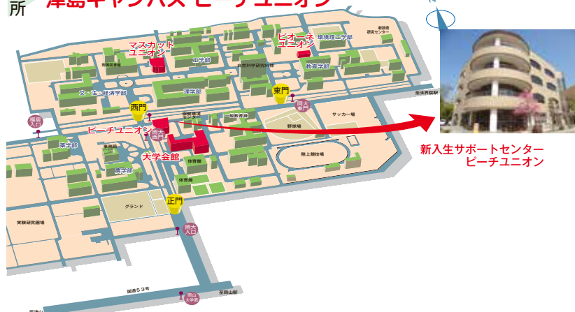
新入生サポートセンター ピーチユニオン

「お部屋探し」や「新入生サポートセンター」の来場予約は 岡山大学生生活協同組合 まで