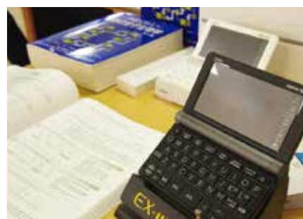
教科書等勉学用品

「新入生サポートセンター」では、岡山大学生の先輩が、お部屋紹介や大学生活相談などのアドバイザーとして活躍しています。