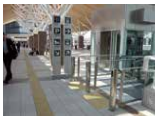
岡山駅在来線中央改札から西に出たところ