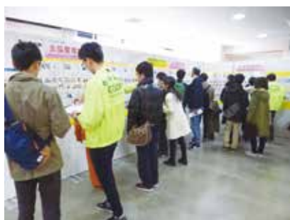
2,000室以上の豊富な物件

○お部屋探し ○生協・共済加入 ○食育ミールカード ○パソコンなど勉学用品 ○教科書購入情報