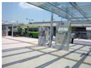
岡山駅運動公園口（西口）バスターミナル付近