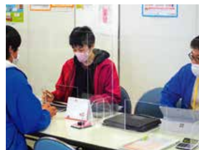
生協・共済加入手続き