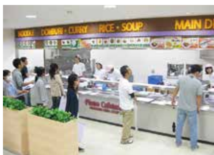
食育ミールカード