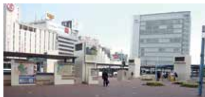
岡山駅後楽園口（東口）バスターミナル付近