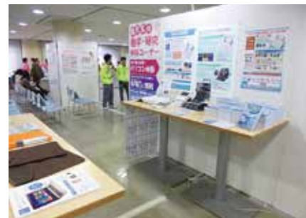
教科書等勉強用品

「お部屋探しの特設会場」では、岡山大学の先輩が、住まい紹介や大学生活相談などのサポーターとして活躍しています。