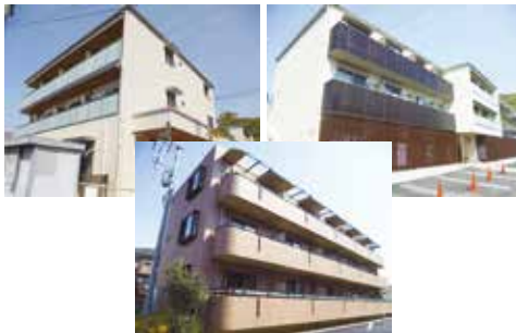
安心の生協管理物件