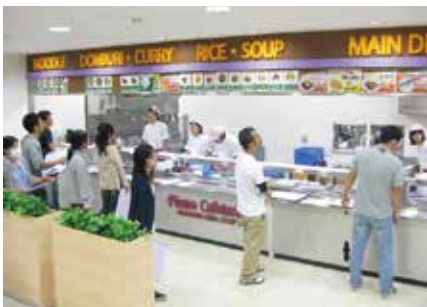
食育ミールカード