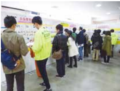
2,000室以上の豊富な物件