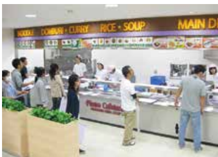
食育ミールカード