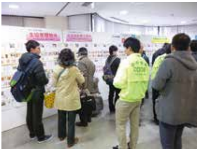
2,000室以上の豊富な物件

○住まい探し ○生協加入 ○食育ミールカード ○パソコンなど勉強用品 ○教科書購入情報