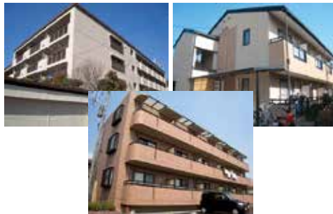
安心の生協管理物件