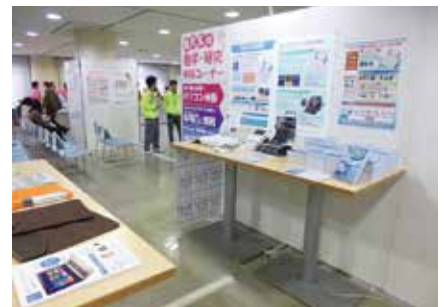
教科書等勉強用品

「新入生サポートセンター」では、岡山大学生の先輩が、住まい紹介や大学生活相談などのサポーターとして活躍しています。