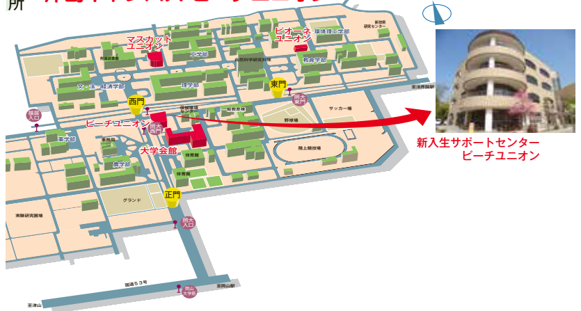
新入生サポートセンター ピーチユニオン