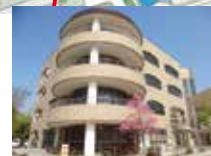
ピーチユニオン3階 (合格前予約会場)